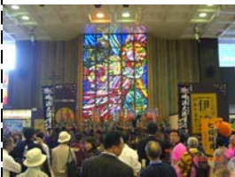
気仙沼の「大漁唄い込み」