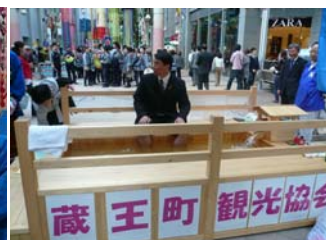
ついでに村井知事もリラックス