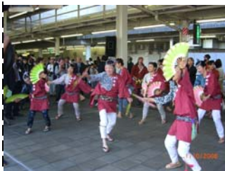
すずめ踊りの軽快な舞い