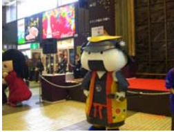
晴れ舞台に緊張気味のむすび丸

中央改札前では観光展が行われ（10/2まで）、多くの市町村パンフレットが瞬く間になくなり、午後から行われた市町村PRイベントでも趣向を凝らした演出がなされ多くのお客さまが足を止めてご覧になっていました。