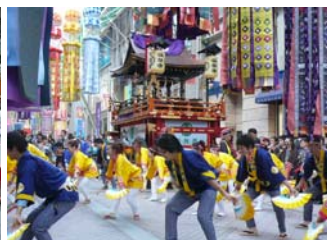
すずめ踊りで皆様を歓迎