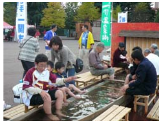
足湯でみなさんリラックス