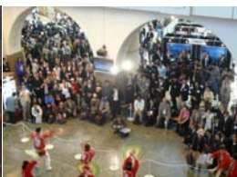
多くのお客さまが足をとめてご覧になっていました。