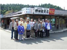
旧佐野社宅ではボラン ティアガイドがお待ち しています