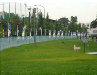
球場周辺はDCのぼり旗一色

9月29日に、「東北楽天ゴールデンイーグルス」の主催試合において、「仙台・宮城デスカンデー～頑張ろう！東北～」が開催されました。仙台・宮城DCのPR活動の一環として行われたこの企画は、球場に足を運んだ楽天ファンに足湯など地元のおもてなしに触れていただきました。