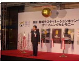
JR東日本小縣副社長のあいさつ