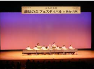
趣味の会会員による大正琴 の披露