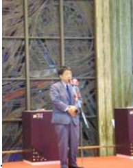
梅原仙台市長からのあいさつ

9/30に仙台駅の2階のステンドグラス及び西口のペDESTリアンデッキがリニューアルされ、記念セレモニーが行われました。ステンドグラスには、LED（発光ダイオード）による七夕などの絵柄を飾り、西口の壁には大型ビジョンを2機設け、観光名所の映像が映し出されます。