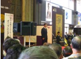
村井会長のあいさつ