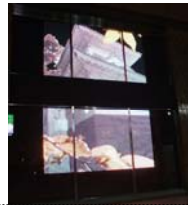
2機の映像で観光地 を紹介します