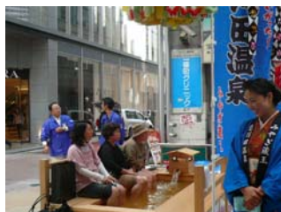
足湯でリラックス