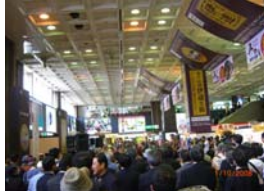
仙台駅2階はDCオープニングで大賑わいでした