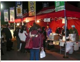
栗原市そばだんごの提供