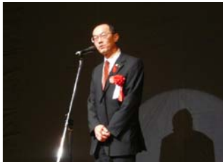
趣味の会フェスティバルでは宮城 県伊藤副知事から歓迎のあいさつ