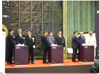
列席者による点灯