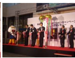
むすび丸も参加したテープカットの様子