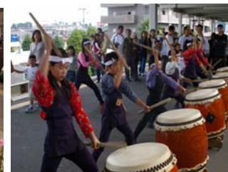
いそ山あかり太鼓の演奏（塩釜駅）