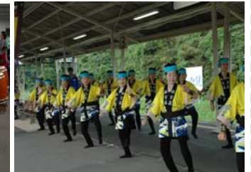
松島太鼓の演奏（松島駅）