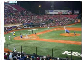
佐々木町村会長（美里町 長）の始球式