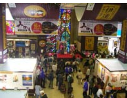
白石市のジャンケン大会