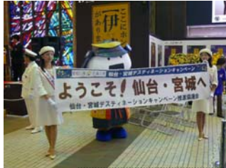
仙台駅到着後の歓迎の様子