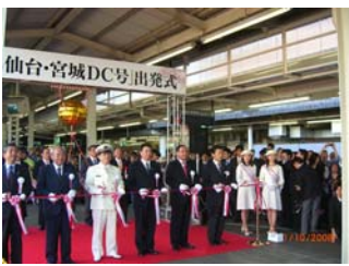
列席者によるテープカット & くす玉開花