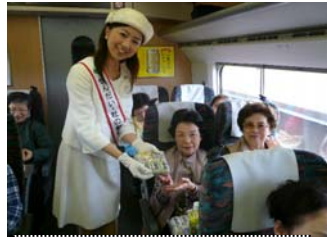
車中では社の都親善大使 からちょっぴりプレゼント