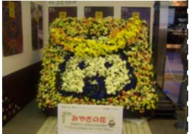
花卉組合の皆様が一生懸命作ったむすび丸の花畑