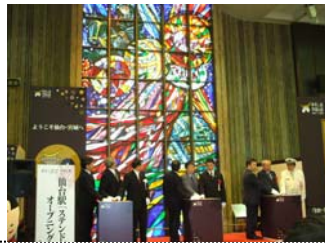
色鮮やかに生まれ変わりました