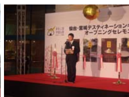
村井会長のあいさつ