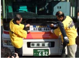
バスステッカーの貼付