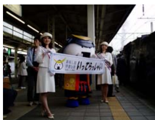
杜の都親善大使とむすび丸もお見送り（仙台駅）