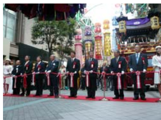
村井知事や梅原仙台市長、丸森会 頭などによるテープカットの様子