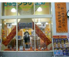
びゅうプラザ上野では甲冑がお出迎え