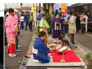
万葉琴の演奏（多賀城駅）