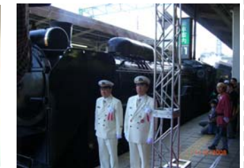
1日駅長の梅原仙台市長が出発合図