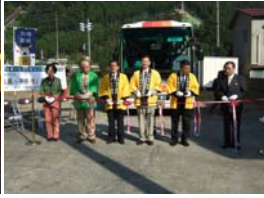
鳴子の観光関係者の皆 様によるテープカット