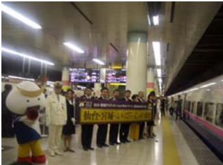
上野駅でのお見送り 「いってらっしゃいませ」

また、仙台駅到着後は、仙台国際センターに移動し、日頃から会員の皆様が取り組んでいる様々な文化活動の成果を発表する「大人休日趣味の会フェスティバルin仙台・宮城」が行われました。ここでは、気仙沼市唐桑地区の「崎浜大漁唄い込み」の披露も行われ、会員の皆様は地元との交流を楽しみました。宿泊先の松島での懇親会でも地元の歓迎を受け、「仙台・宮城」を満喫していただきました。