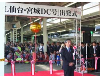
JR東日本田浦仙台支社長からのあいさつ