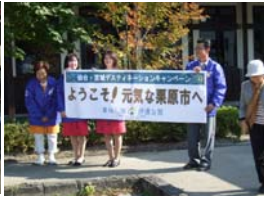
花山自然薯の館での歓 迎