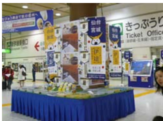
上野駅は仙台・宮城DC一色でした