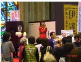
石巻市の「すずりん」とのジャンケン大会