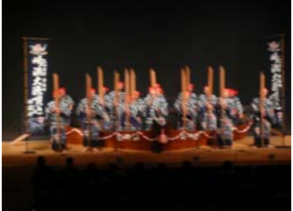
会員の皆様が興味津々だった 「大漁唄い込み」