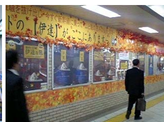
池袋駅でも大々的に装飾をしていただきました