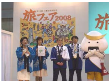
宮城・岩手のおかみが元気 いっぱいPR!

悪天候にも関わらず総来場者数は10万人を上回り、大変な賑わいを見せることができました。ブースステージでは20日にDCのPR、22日に宮城県のPRを実施し、むすび丸とO×クイズによる県産品のプレゼントを提供しました。また、21日には会場内サブステージにてDCのPRを行い、抽選で県産品や宿泊券を提供し、多くの方々に仙台・宮城をアピールできました。