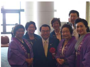
国土交通大臣が駆けつけて下さり、 おかみ達と記念にパチリ!