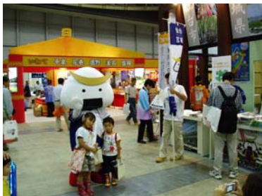
ここでもむすび丸は子ども 達に大人気