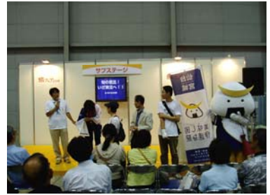
見事勝ち残ったお客様にプ レゼントの贈呈です。