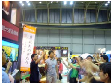
宮城県の特産品が当たるという ことで、お客様も大盛り上がり!