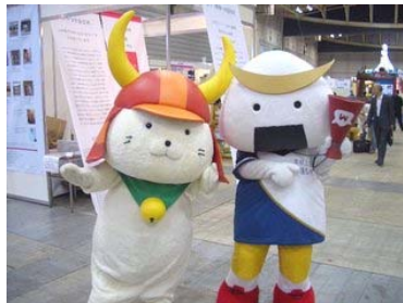
会場内で沢山のお友達が出来て上機嫌のむすび丸