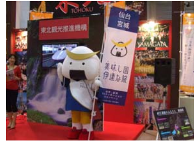
仙台・宮城に来てけさ〜い!