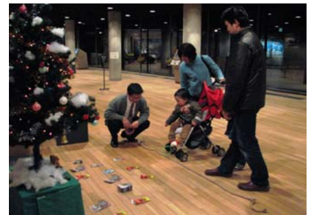
サン・ファン・イルミネーションとファンタジーフェスタを楽しむ家族連れ。