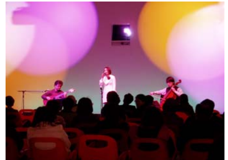
定禅寺ストリートジャズフェスティバル出演者による演奏を、多くのお客様が聞入っていました。