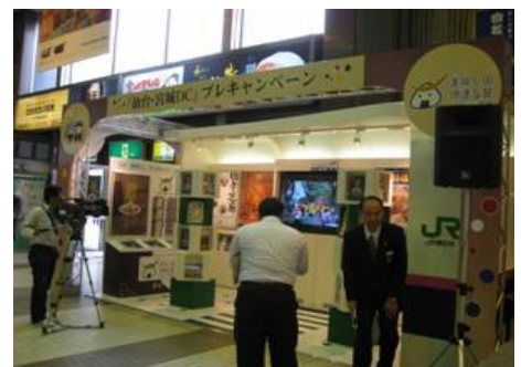
イメージ(プレDC時の映像) 現在は、コーナーを縮小しています。

JR仙台駅でプレDC期間に開催エリアの観光情報コーナーとして活用してきた「Tサイト」は、プレDC終了後情報コーナーを縮小しましたが、引続き各市町村の観光情報を掲載したパンフレット等を置くことが可能です。是非ご活用ください。設置条件等については、DC推進協議会事務局へお問合せください。