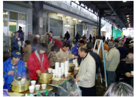
志津川のたこや新鮮な水産品が並ぶ会場と、お買物を楽しむお客様。