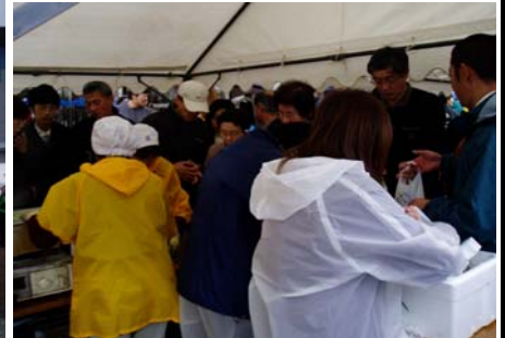
カキの即売コーナーでもお客様の列が続いていました