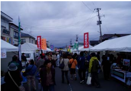
栗原市産業祭り会場の賑わい

栗原市岩ヶ崎の馬場通りを会場に、栗原市産業祭り「らずもねえ祭りinくりはら」が盛大に開催されました。会場の馬場通りには地域の物産や体験コーナーが数多く出店され、買物や体験を楽しまれています。隣接の旧くりはら田園鉄道・栗駒駅では、駅構内約400mでくりはら田園鉄道の復活運転が行われ、子供連れの家族や鉄道ファンで賑わっていました。