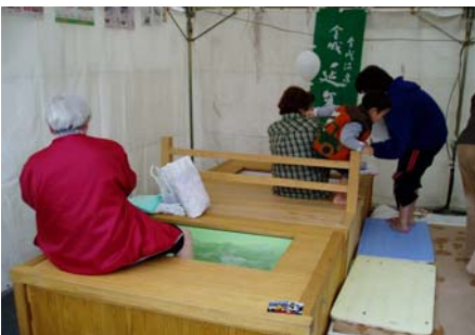
会場には地元温泉の足湯コーナーも