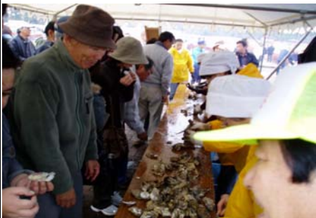
会場の焼きカキ無料提供コーナー

東松島市では、プレDCの特別企画として初めて東松島カキ祭りを開催しました。東松島特産おいしいカキのPRと販売を行う企画で、会場の奥松島公園では焼きカキやカキ汁の無料提供コーナーや即売コーナーではお客様の列が続いていました。