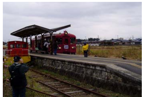
旧栗駒駅構内での、くりはら田園鉄道の復活運行