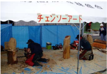
チェーンソーによる木像作りのコーナーでは多くの方が見学