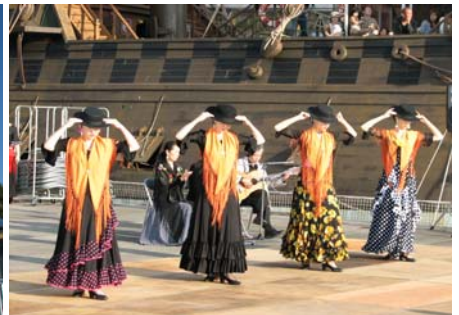
遣欧使節にちなみフラメンコの踊りが披露