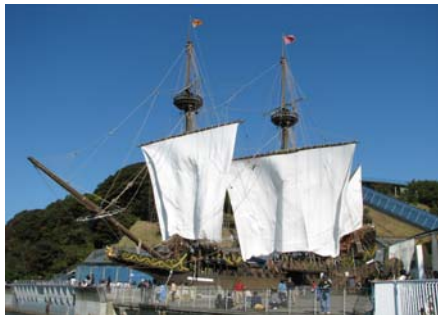
帆を張ったサンファンパウティスタ号もお披露目