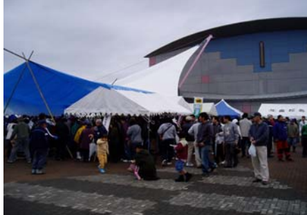
カキ祭り会場は多くのお客様が来場して賑わっていました