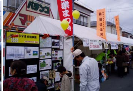
会場には、秋田県湯沢市の観光コーナーも置かれていました