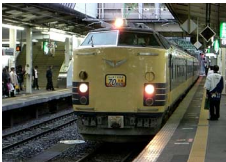
仙台駅へ到着した「仙山線開通70周年号」のお出迎え風景

宮城県仙台市と山形県山形市を結ぶ、JR仙山線が全線開業70周年を迎え、特別列車が同区間に運転されました。沿線の駅では地元協力によるイベントが多彩に催され、DC推進協議会もじよく全国からおいでになったお客様へ、DCのPRと缶バッチのプレゼントを行いました。