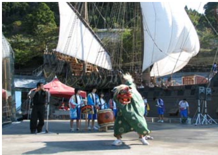
会場では地元獅子踊りの披露

10月27日に宮城県慶長使節船ミュージアム(サン・ファン館)において「サン・ファン秋祭り」が開催されました。サン・ファン館に係留されている木造帆船「サン・ファン・パウティスタ」のマストに帆を張り美しい姿が披露されました。