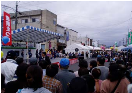
会場の中心には、ステージイベントも開催されました