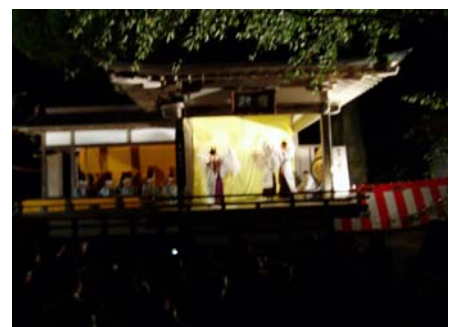
能楽堂での舞楽と神楽