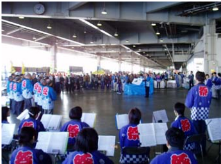
産業まつり関係者によるオープニング セレモニー

● ■10月28日(日) 第24回気仙沼・本吉地方産業まつり 気仙沼市・本吉町・南三陸町 ● 気仙沼市魚市場を会場に、プレDCの特別推奨まつりとして今年も盛大に「気仙沼・本吉地方産 ● 業祭り」が開催され、多くのお客さまが来場されました。日本一の鉄火巻き大会や、魚市場から大 ● 島外洋クルーズ船が運航されるなど、新鮮な海産物の買物と観光が連携したイベントとなってい ● ました。