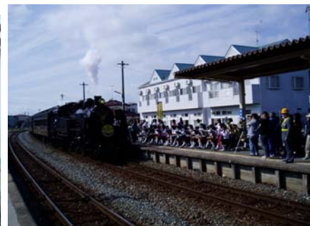
渡波駅では、地元中学生による吹奏楽でお出迎え