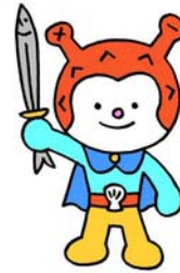
海の子 ホヤぼーや