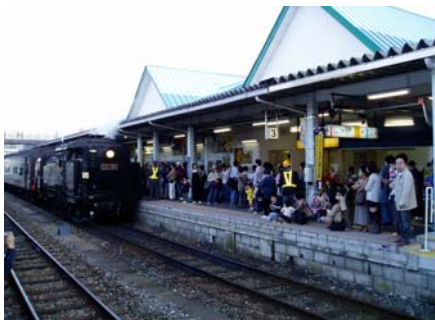
石巻駅でも石巻市による、お出迎えイベントを実施、多くのお客さまで賑わう