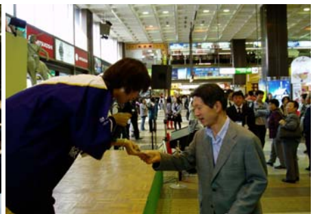
勝ち抜いたお客さまには、プレゼント品を提供