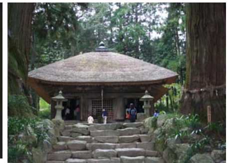
プレDCの特別企画として公開された、高蔵寺・阿弥陀堂の公開風景