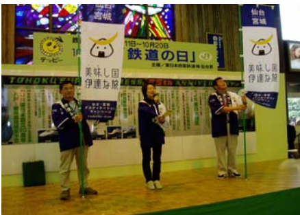
ステージでのDC協議会によるプレDCのPR