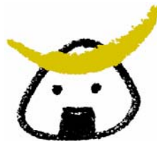
気仙沼市観光キャラクター