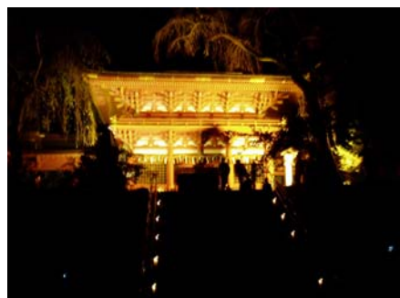
塩竈神社の灯り演出風景