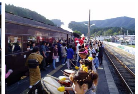
女川駅でも女川町によるお出迎えと出発イベントが盛大に行われた