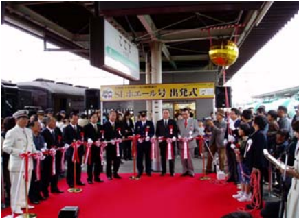
小牛田駅での関係者による出発セレモニー風景

10月20日と21日の両日、仙台・宮城DCプレキャンペーンを記念して、石巻線の小牛田～女川間に33年ぶりにSLが運行され多彩なイベントも行われ、各駅をはじめ沿線では全国からの旅行者や地元の皆さんが走行風景を楽しみました。盛んにシャッターを切っていました。