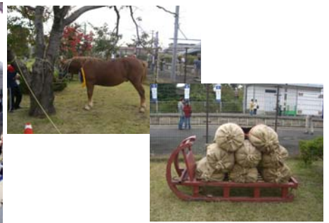
涌谷駅では、春の挽馬競技大会に使われる、実物がお出迎え