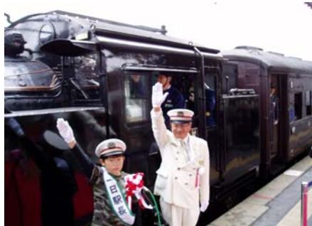
地元小学生の1日駅長によるSL出発進行合図