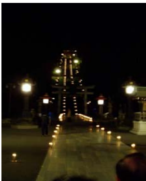
塩竈神社表坂(階段)の灯り演出と風景

仙台・宮城DC全国宣伝販売促進会議のエクスカージョンに合わせて、塩竈市では夜の塩竈神社をローソクの灯りで演出する、「しおがまさま 神々の月灯り」が3日間行われました。秋の風情あふれる夜の塩竈神社を多くのお客さまが訪れ、また能楽堂では舞楽は披露されました。