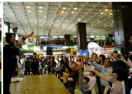
会場のお客さま参加による、ジャンケン大会を実施