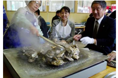
「かき小屋」殻付き焼きかきの実演風景