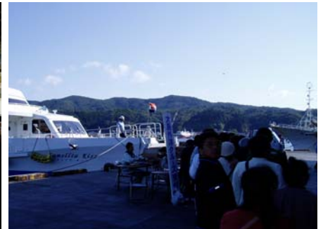
気仙沼大島外洋クルーズの受付風 景、どこから訪れたか聞き取りを実施