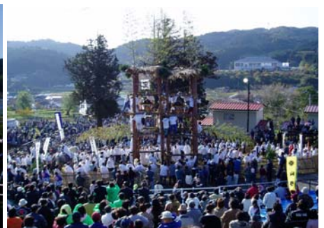
本宮・新宮神輿の競い合いと、マツリバ会場の風景、松の櫓に引き上げられ安置された神輿風景