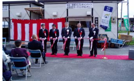
松島町の観光関係者によるテープカット