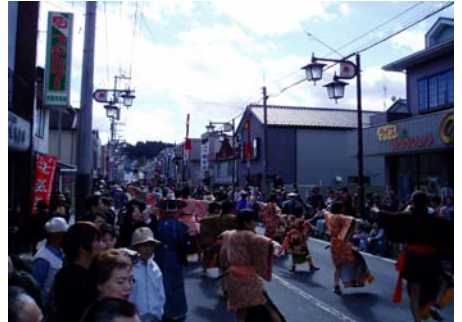
山田大名行列。本吉町津谷町内を練り歩く風景です。是非、一度足を運んでみてはいかがでしょうか。