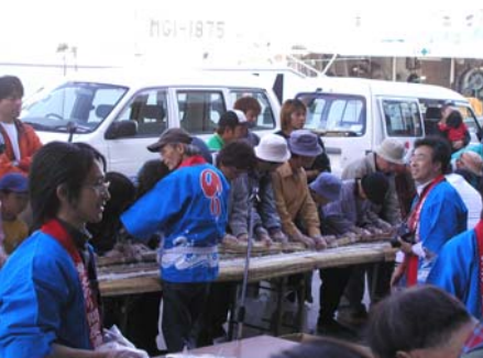
日本一の鉄火巻308mの挑戦風景