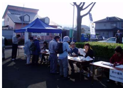
あぶくま急行高子駅での受付風景

10月7日、伊達家のふる里である伊達市で、伊達家発祥とゆかりの地を巡るウォーキングイベントが開催されました。400名の募集を上回る450名様が秋の清々しい風の中、11KMの行程を楽しみました。運営面では、阿武隈急行沿線開発協議会にも協力いただき、県境を越えて取り組みました。