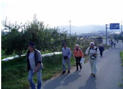
秋のさわやかな風のなか、参加者のウォーキング風景