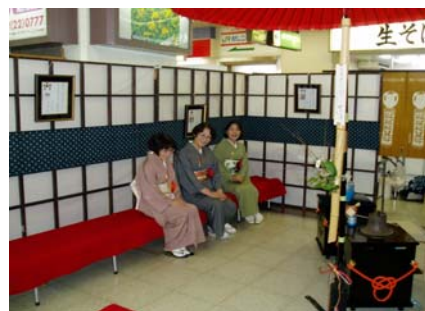
セレモニー会場には茶室もお目見えし、抹茶が提供