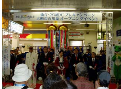
伊藤大崎市市長・蜂谷古川駅長らによるオープニングセレモニー