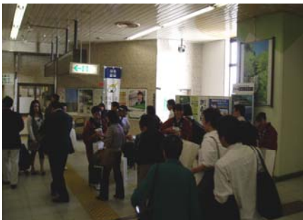
鳴子温泉の女将さん達による観光旅行者のお出迎え

10月6日、大崎市では独自に「仙台・宮城DC」プレキャンペーンのオープニングイベントを開催し、東北新幹線で古川駅に到着した旅行者への鳴子温泉の女将さん達のお出迎えや歓迎イベントが盛大に行われ、地元の皆さんとともに大いに盛り上がりしました。