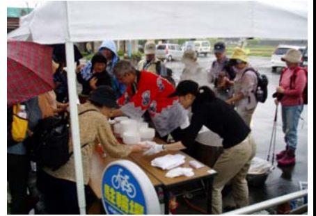
秋保のゴール、里センターでの芋煮の提供風景