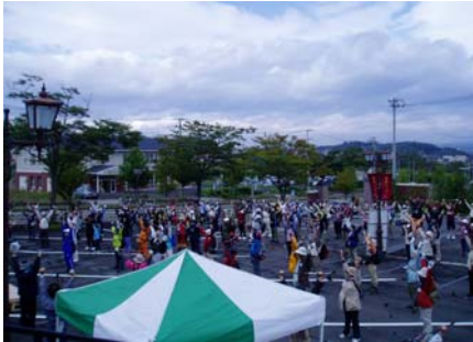
出発前、参加者準備運動の風景

10月8日、仙台市の秋保温泉関係者とJR東日本「駅からハイキング」で共催された「秋保温泉ノルディックウォーク」が開催されました。コースは愛子を出発しさいかち沼を經由して秋保温泉を目指す約6KMの行程で150名を越える参加者がありました。秋保温泉到着後は芋煮の提供と温泉で疲れを癒していただきませう。