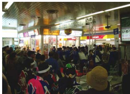
古川学園高校の生徒による吹奏楽の演奏