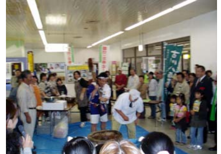
新米もち米による餅つき実演とお客様への提供