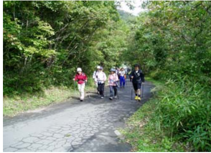
コースでのノルディックウォーク風景