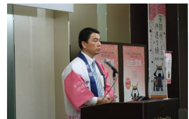
村井会長も駆けつけました!