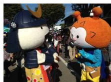
飛び入り参加したホヤぼーやと