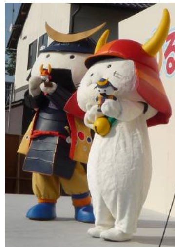
ひこにやんとぬいぐるみの交換