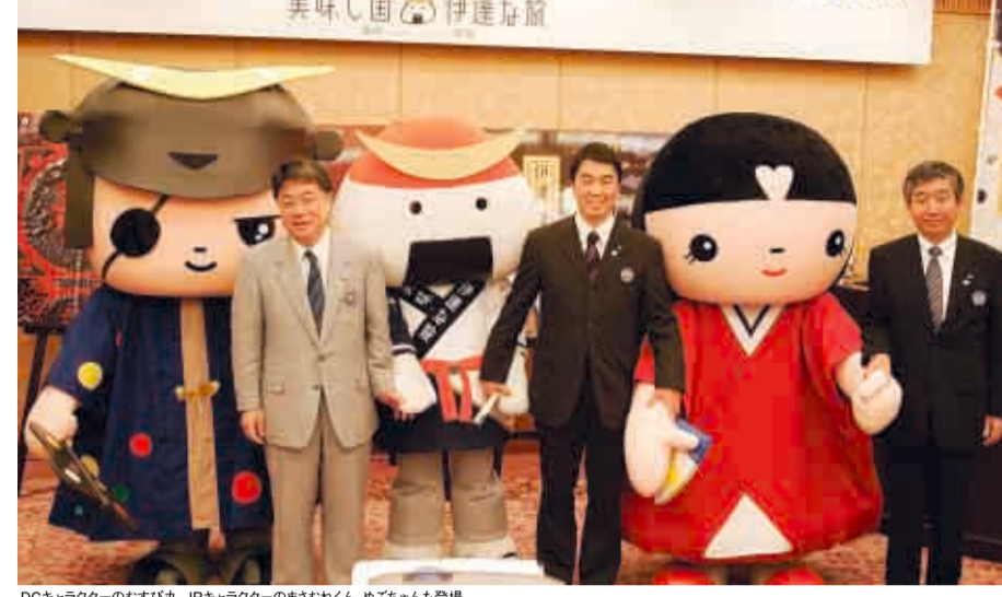
DCキャラクターのむすび丸、JRキャラクターのまるまわくん、めろちゃんも登場

仙台市のぶらんどむー一番町商店街では10月1〜5日に秋の七夕が飾り付けられます。大崎市では紅葉のときに、鳴子温泉駅と鳴子駅を結ぶシャトルバスを運行。栗原市では近代化産業遺産に認定された細倉鉱山開運施設の見学や伊豆沼・内沼ののんびり立ち観覧会を実施。そのほか、女川町のサンマつかみ取り体験や気仙沼市のふかひれウイーク、白石市のまるごとうめくんとつりなど食のイベントも開催されます。