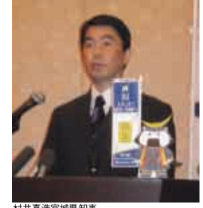
村井嘉浩宮城県知事

10月1日から始まる仙台・宮城デスティネーションキャンペーン(DC)を前に、今月22日ホテルメトロポリタン仙台で、報道関係者に向けたDC推進協議会とJR東日本仙台支社による共同の説明会が開かれました。DC推進協議会の会長・村井嘉浩宮城県知事、会長職務代行副会長・梅原克彦仙台市長、田浦芳孝JR東日本仙台支社長(副会長)のほか、推進協議会とJRの各担当者が、DCの目的や宣言、実施概要について発表しました。