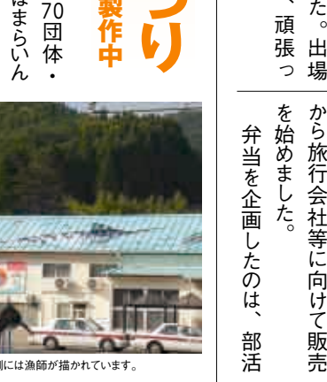
中央にカジキマグロ、左側には漁師が描かれています。