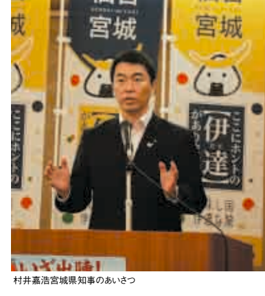
村井嘉浩宮城県知事のあいさつ

もうすっかりお馴染みの仙台・宮城DCのシンボルキャラクター「むすび丸」。県内各地に出陣し、DCの宣伝に大活躍ですが、今度は「ぬいぐるみ」になって登場しました。