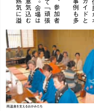
県産食材を使った「おもてなしまごころ弁当」