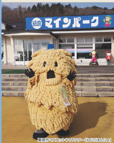
栗原市マスコットキャラクター「ねじりほん」