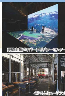
栗駒山麓ジオパークビジターセンター