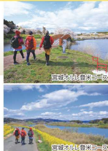
宮城オルレ登米コース