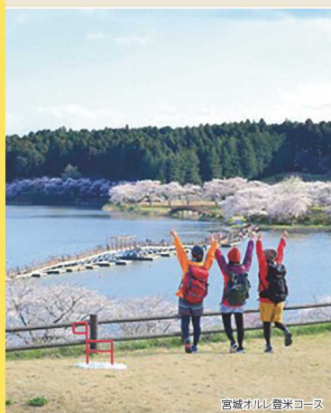
宮城オルレ登米コース