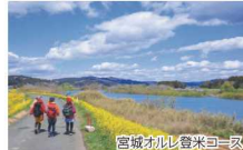
宮城オルレ登米コース