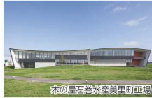
木の屋石巻水産美里町工場