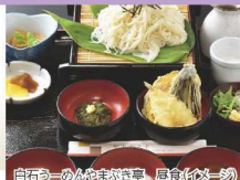
白石うーめんやまぶき亭 昼食(お一人様)