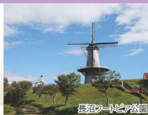
長沼フートピア公園