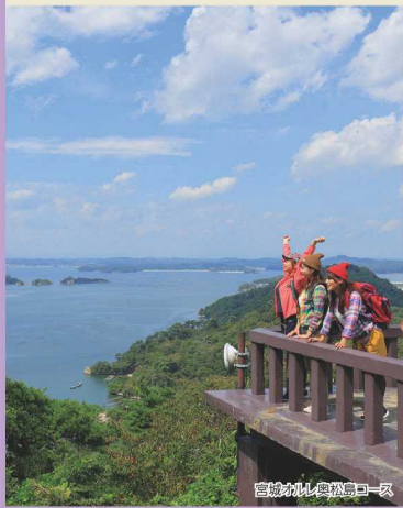
宮城オルレ奥松島コース