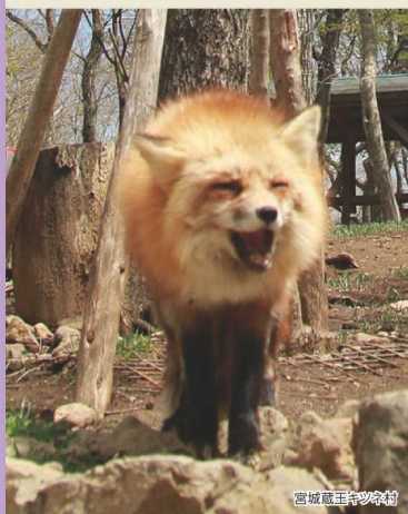
宮城蔵王キツネ村