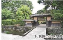
片倉電舟武家屋敷