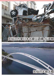
気仙沼市東日本大震災遺構・伝承館