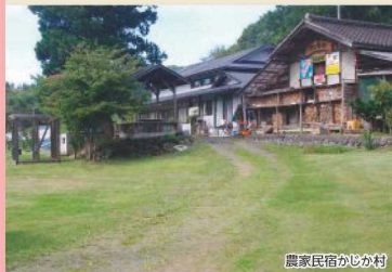
農家民宿かじか村