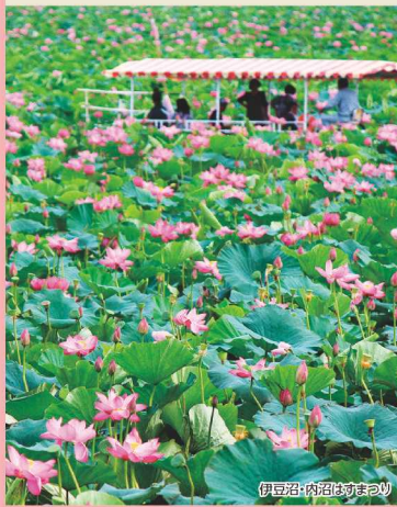
伊豆沼・内沼はすまつり