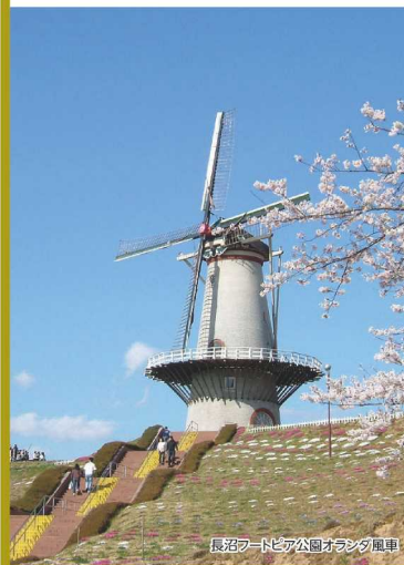
長沼アドヴィック公園オランダ風車