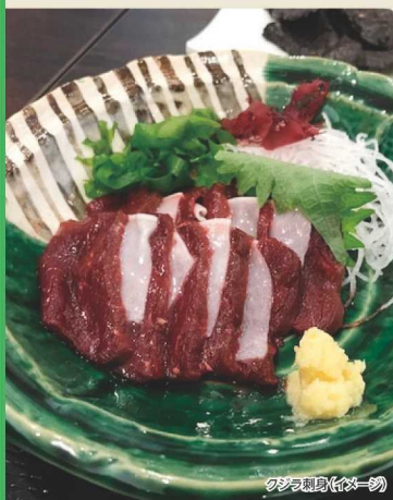
クジラ刺身(イモト)