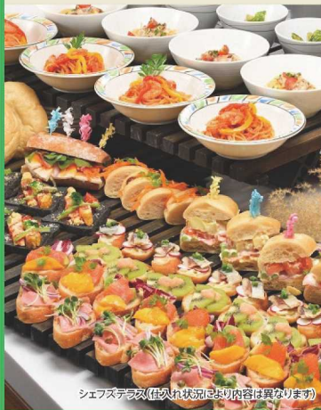
シェフズテラス(住入れ状況により内容は異なります)