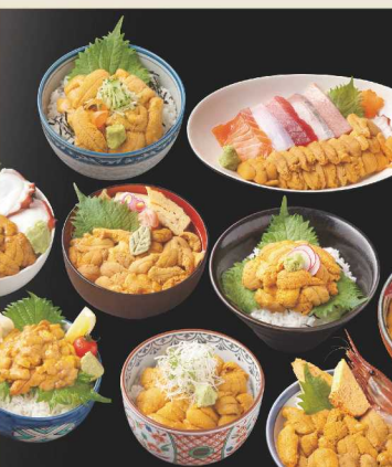
南三陸キラキラうに丼(イメージ)