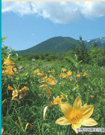
世界谷地原生花園