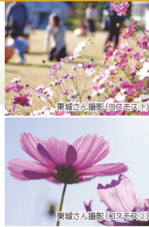
(白コスモス)