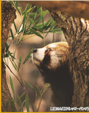
(ローバーパン)