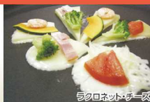
ラビオネット・チーゴ