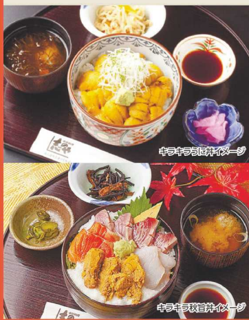
旬のランチは秋旨并イメー