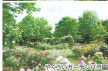
やくらいガーデンバラ園