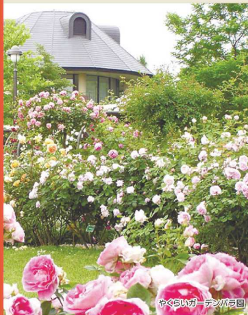
やくらいガーデンバラ園