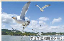
ウミネコ風景イメー