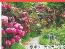
泉ポタニカルガーデン