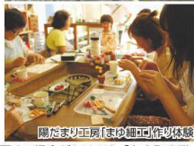
陽だまり工房「まゆ細工」作り体験