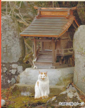
丸森町の猫イメー