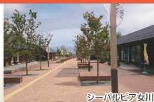
シーパルピタ女川