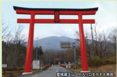
霊峰蔵王山への入り口を示す大鳥居