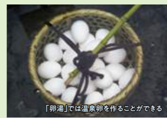
「卵湯」では温泉卵を作ることができる