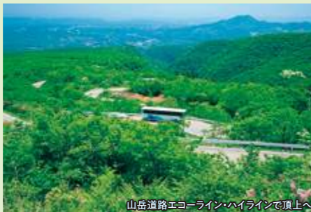
山岳道路エコーライン・ハイラインで頂上へ