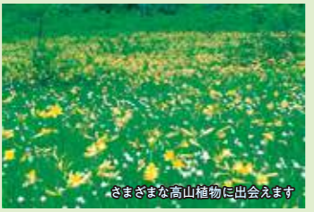
さまざまな高山植物に出会えます