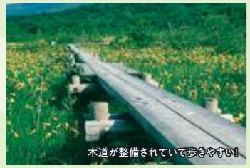
木道が整備されていて歩きやすい

【場所】栗原市栗駒沼倉(栗駒山いわかがみ平)、栗原市栗駒沼倉耕英南163(世界谷地原生花園) 【アクセス】JR東北新幹線くりこま高原駅から車で約70分 ☎0228-25-4166(栗原市観光物産協会)