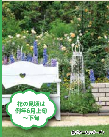
奥平タニカルガーデン