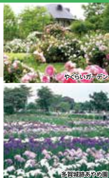
やくらいガーデン