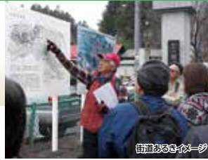
街道あるきツアー