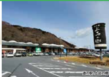
道の駅・上品の郷