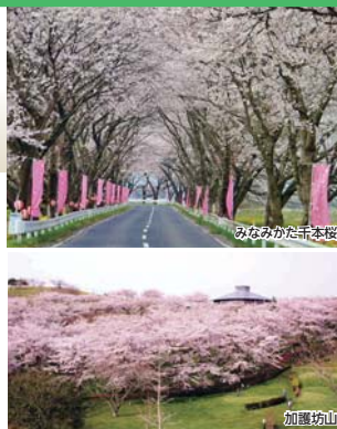
みなみかた千本桜