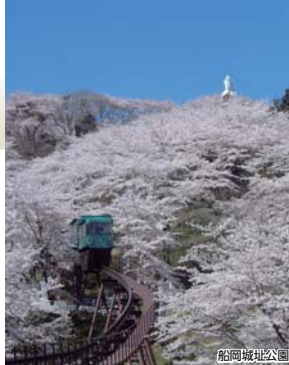
※スロープカーは別料金500円