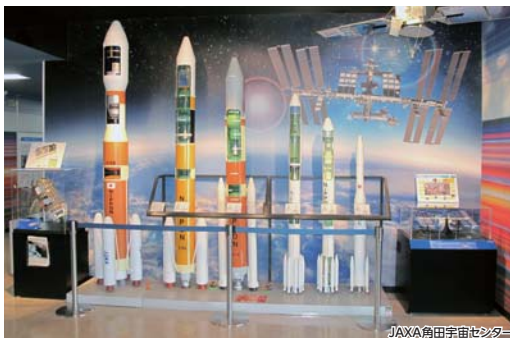
JAXA 角田宇宙センター