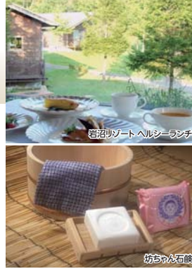
岩沼リゾート ヘルシーランチ