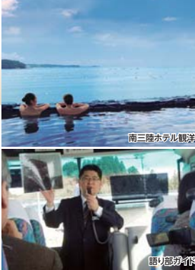
南三陸ホテル観洋